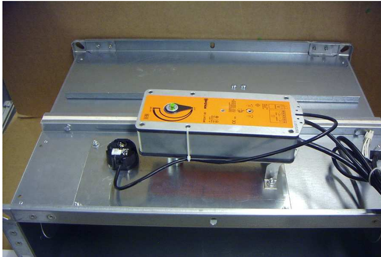
Ansicht Bedienseite - Antrieb

- Anbauplatte mit Muttern M6 befestigen.