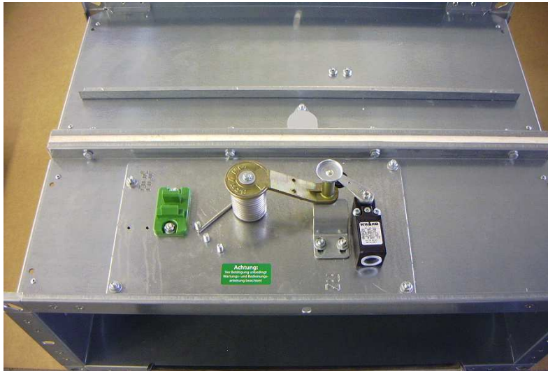
Ansicht Bedienseite Handauslösung