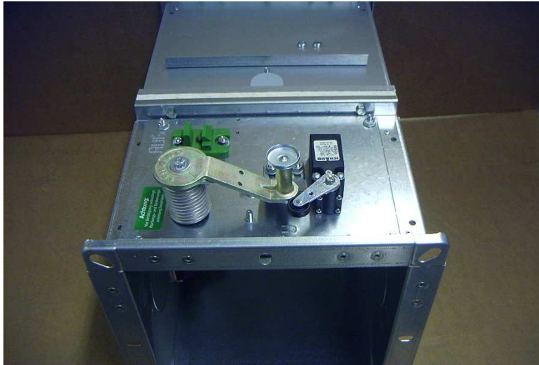
Ansicht Bedienseite Handauslösung