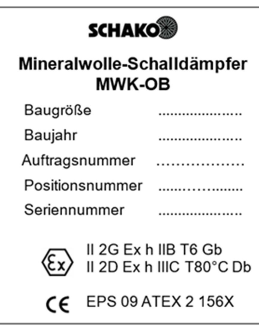
Figure 1: MWK-OB ATEX type plate