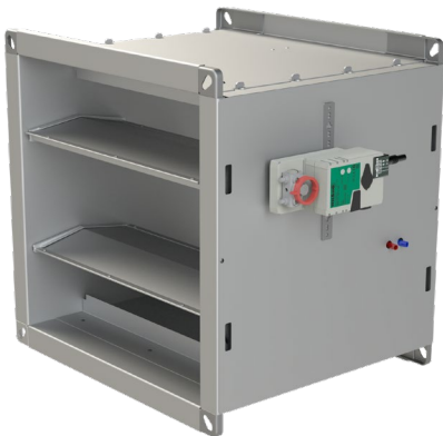
Volumenstromregler SCHAKO VHPQ400