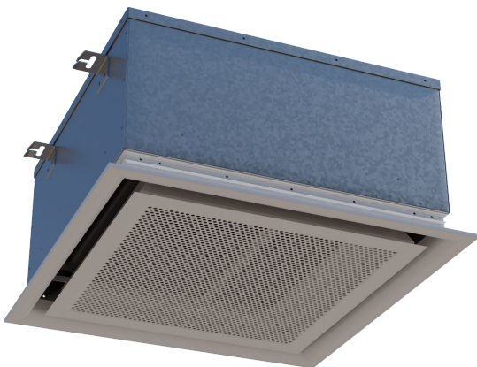
SCHAKO UKGW - Kassette