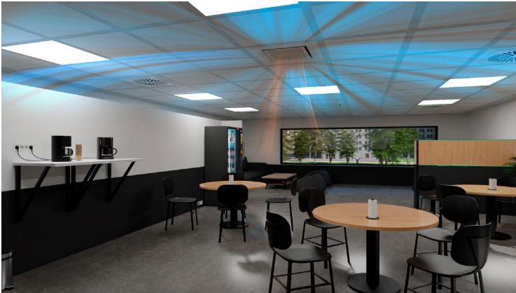
Strömungsbild SCHAKO UKGW - Kassette