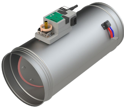
Volumenstromregler SCHAKO VHPR200

Die folgenden bereitgestellten Abbildungen zur Presseinfo dürfen unter Nennung der Bildquelle SCHAKO zu journalistischen Zwecken frei verwendet werden: